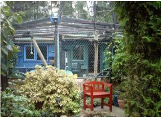
Katzenklappen ermöglichen einen gesicherten Freigang auf eine katzensichere, vielfältig ausgestattete Terrasse.